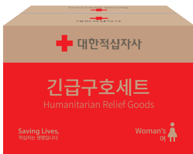
Type B(후원사 표기)